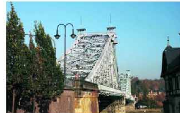
"Aufstieg" vom Schillerplatz: Nur wenige Meter zum "Blauen Wunder" und SchillerGarten