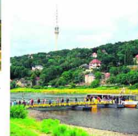
Alltkewitz in Laubegast: Mit der Fähre näher zum Elbhang