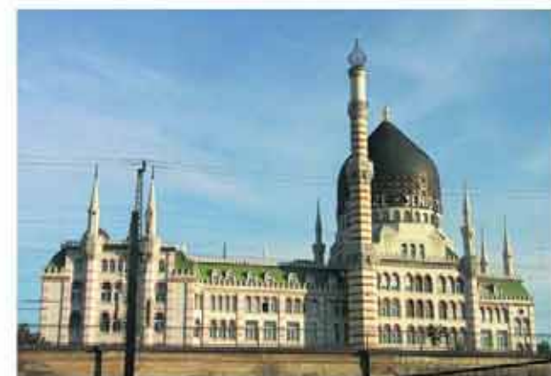
Die Pracht der Yenidze: Orientalische Architektur an der Marienbrücke