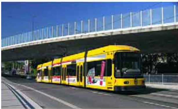
Über die neue Löbtauer Straße: Vom Westen direkt zum Bahnhof Mitte und in die Neustadt

Die Straßenbahnlinie 6 berührt das Stadtzentrum nur am Rande. Daraus ergibt sich für die Nutzer der Vorteil einer so genannten Tangentiallinie: Von den Wohngebieten am Stadtrand werden auf ihrem Weg ums Zentrum herum viele Linien berührt und somit günstige Übergänge angeboten. Egal ob zur Schule oder Arbeit, ob zum Zug oder für sonstige Alltagsgänge - mit der "6" kann man viel Zeit sparen.