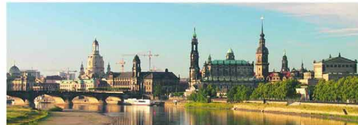
Blick von der Marienbrücke: Die Stadt sehen wie einst Canaletto

Statt einsteigen bitte eintreten oder 'reinfahren' • Anteil der behindertengerechten Haltestellen 38,6 % • zunehmender Einsatz von Niederflurstadtbahnen der Typen NGT6DD und NGT D8 DD