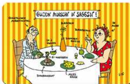
Guddn Morschn in Saggsn