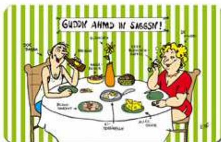
Guddn Ahmd in Saggsn